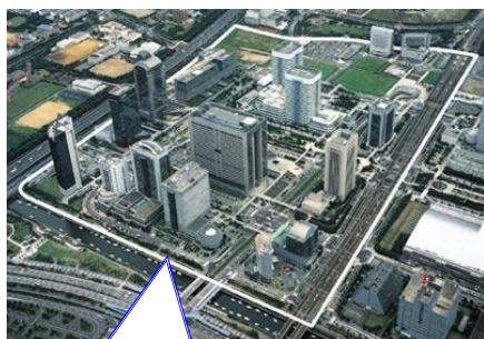
＜処理水熱利用事例＞ 幕張新都心・ハイテク ビジネス地区 (千葉県)